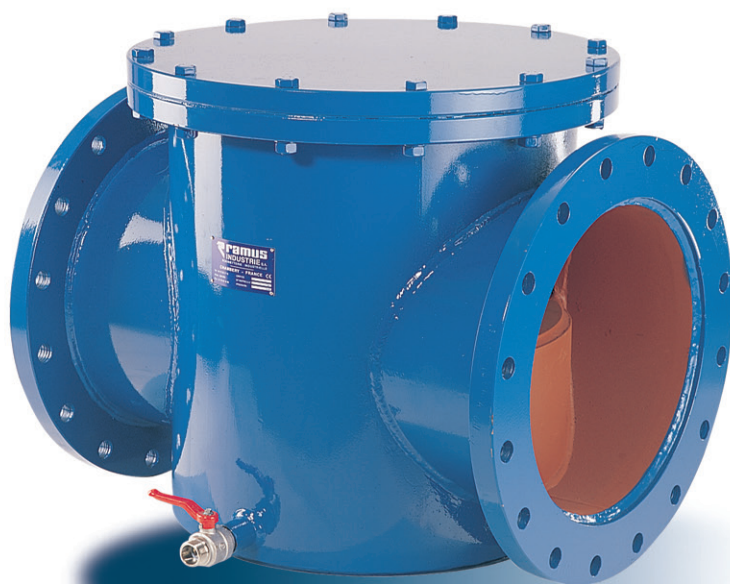
Type FILTRAM CD