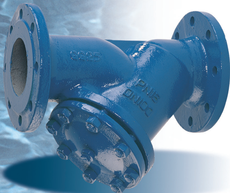
Type FILTRAM CM

Fluid control : a manufacturer gives you his guarantees