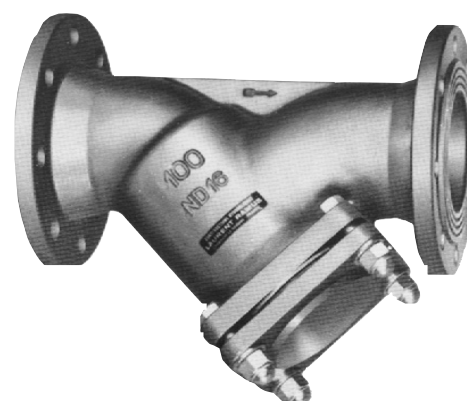
FILTRE OBLIQUE A BRIDES PN 10 TYPE FILTRAM DN 100

Le FILTRE OBLIQUE A BRIDES, TYPE "FILTRAM", SÉRIE "CM", doit être installé en amont des appareils régulateurs et autres selon la direction d'écoulement indiquée par une flèche sur le corps de l'appareil.